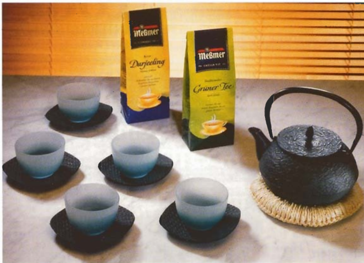
Abb. 1 Beispielsweise verbessert die mit den Teemarken Milford und Messmer in Deutschland vertretene Laurens Spethmann Holding ihr internationales Supply Chain Management mit Komponenten aus der iProcess.sct-Produktfamilie

Die Supply-Chain-Management-Lösung iProcess.sct wurde speziell auf die komplexen Problemstellungen der Lebensmittelindustrie zugeschnitten. Das von dem Nürnberger Unternehmen Systems & Computer Technology entwickelte Lösungspaket deckt die ganze Bandbreite des Supply Chain Managements ab, beginnend beim Advanced Planning, Demand Planning und der Feinplanung über die Internetanbindung von Kunden und Lieferanten bis hin zum Relationship Management.